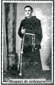
Después de ordenarse