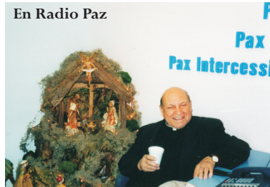
En Radio Paz