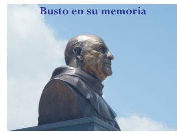
Busto en su memoria