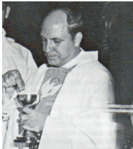
25 Años de Sacerdocio