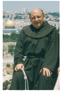
En Tierra Santa

Te invitamos a que nos acompañes el Domingo 12 de Abril próximo a las 6:15 PM en Casa Caná para celebrar el 10o. Aniversario de su regreso a la casa del Padre. "Pasó por el mundo haciendo el bien."