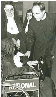
Llegada a Miami