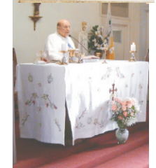
54 Años de Sacerdocio