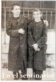
En el seminario