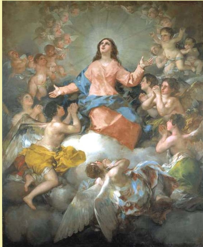
Francisco Goya y Lucientes, Assunzione della Vergine, Chiesa parrocchiale, Chinchón

Virgen Santa, por Dios predestinada a aplastar la cabeza a la serpiente, regresas al origen, a la fuente, al templo de tu amor, a tu morada. Eres, por siempre, Madre Inmaculada, la cuna del perdón, la confidente, la intercesora fiel, dulce y clemente,